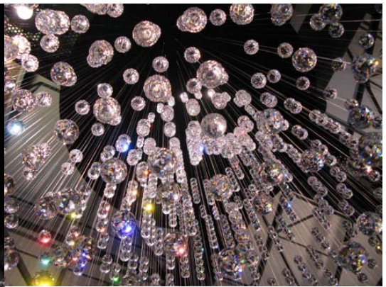
Ron Arad's 'Miss Haze' for Swarovski e FredriksonStallard's Pandora chandelier