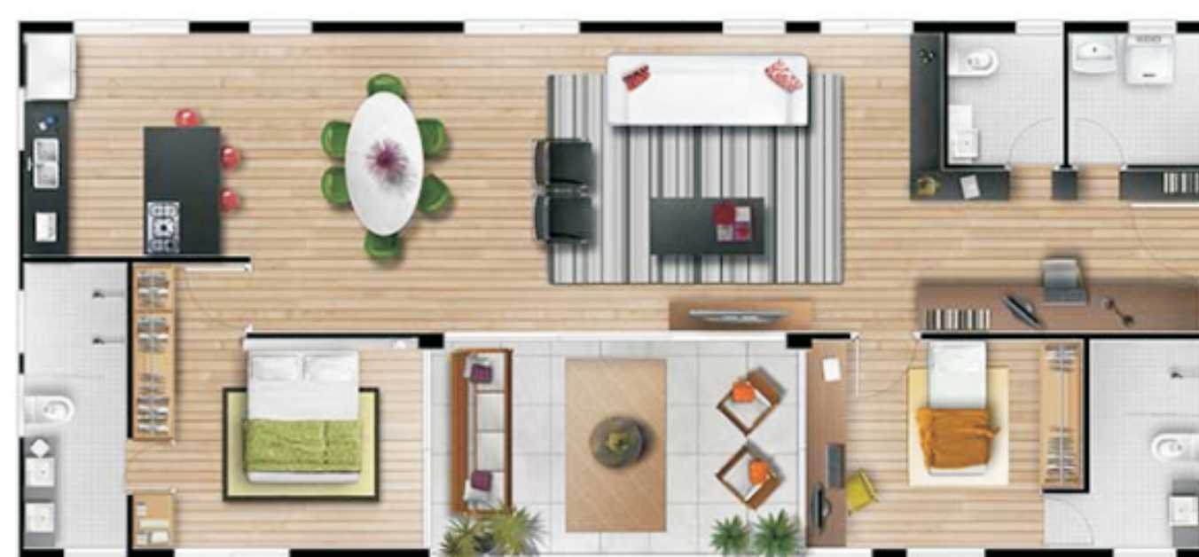
00_256 - Fidalga 727 http://www.movimentoum.com.br/movimentoum/fidalga727/

Pretende-se contribuir para ampliar o entendimento da história e da evolução dessa modalidade habitacional, dando continuidade a um trabalho que já vem sendo desenvolvido há nove anos sobre esse assunto, por vários pesquisadores, no Nomads.usp – Núcleo de Estudos de Habitares Interativos da Universidade de São Paulo. Como resultados preliminares da pesquisa foram incluídas no banco de dados informações e peças gráficas de apartamentos recentes. Também foi produzido material incluído em trabalho de outros pesquisadores do Núcleo relacionados à esta pesquisa.