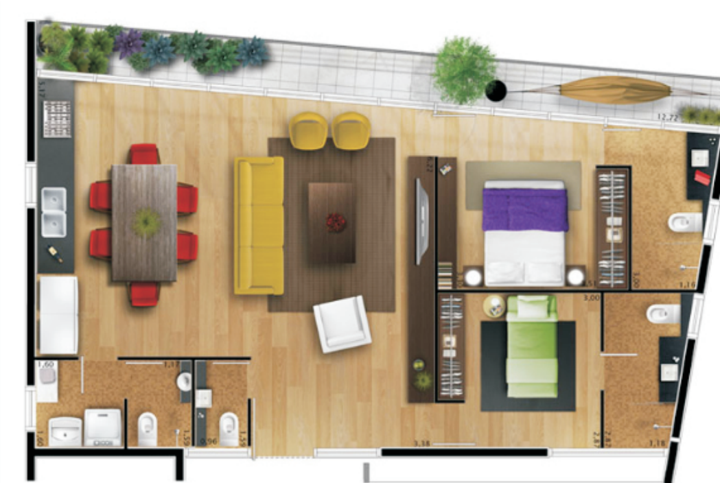
00_255 - Simpatia236 www.movimentoum.com.br/movimentoum/simpatia236/