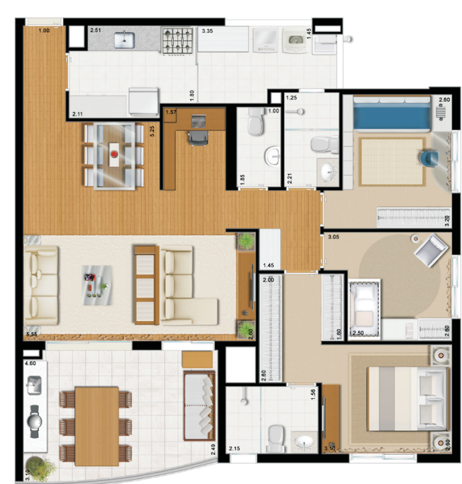
00_246 - Grandlife Ipiranga www.cyrela.com.br/Web/ficha/grandlifeipiranga/

As primeiras análises do banco de dados de apartamentos e leituras das plantas revelam que é possível encontrar exemplares nos quais não se verificam os seis pontos, porém, nesses projetos, isso parece estar relacionado, geralmente, a questões econômicas e redução de áreas, sem que haja uma revisão da estrutura espacial. Contudo, verifica-se uma oferta inicial de apartamentos com características inovadoras.