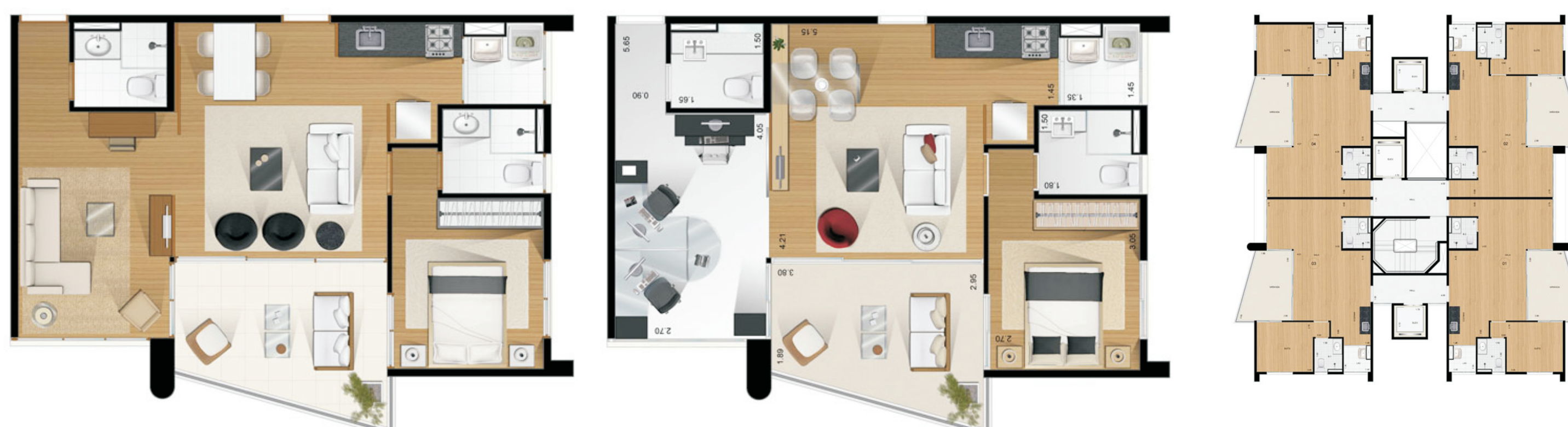
00_242 - Combinatto www.bko.com.br/Empreendimentos/Combinatto/tabid/87/Default.aspx