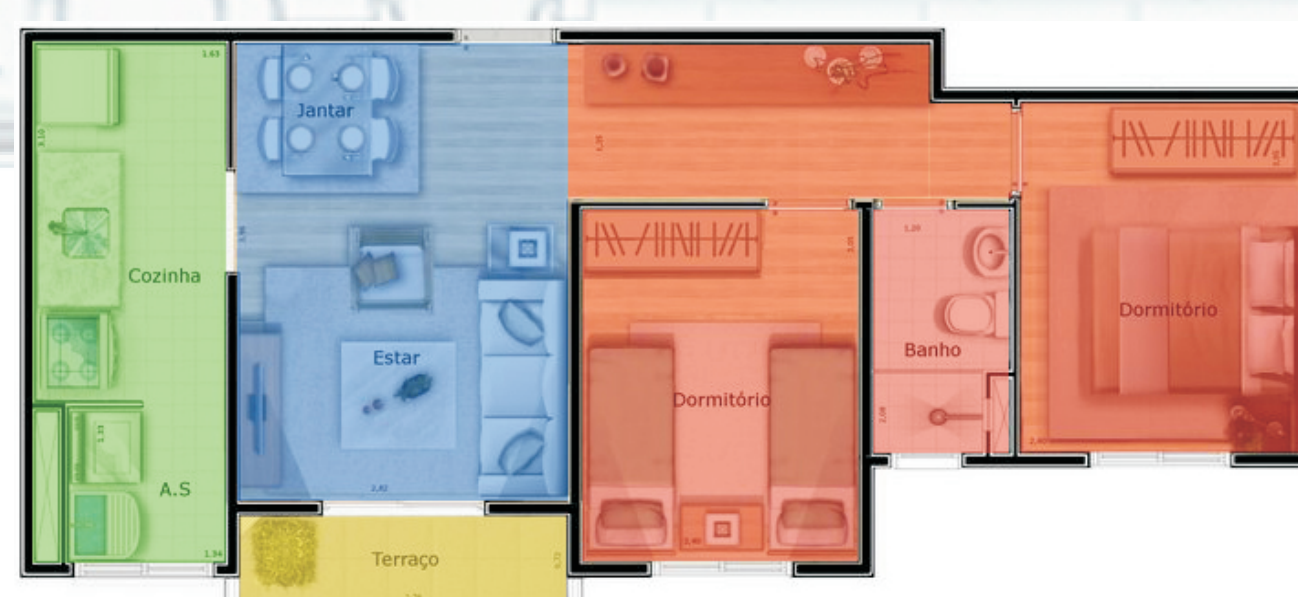
00_244 - Firenze