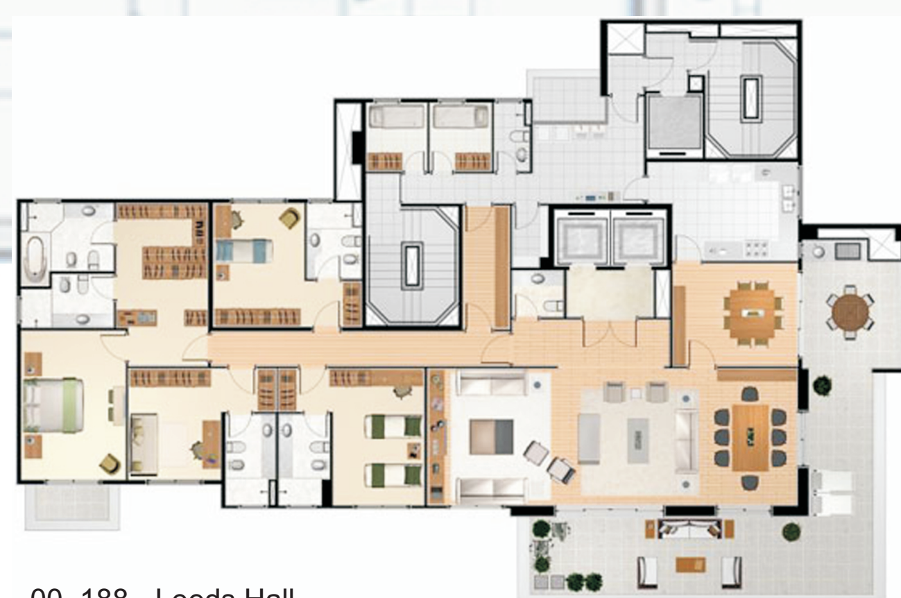
00_188 - Leeds Hall

As leituras espaciais são realizadas com base em seis pontos recorrentes no desenho dos apartamentos: (1) a existência de cômodos, (2) a vinculação destes à funções específicas, (3) a hierarquia entre os cômodos, (4) a tripartição da habitação em zonas Íntima, Social e de Serviços, (5) a presença de corredores de circulação e (6) a hierarquia entre circulações.