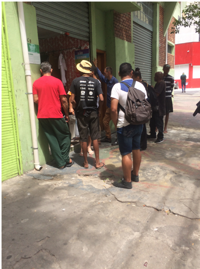
Fig. 1: Fotografia em outubro de 2019 com fila de pessoas em situação de rua aguardando atendimento na ONG. A rotina de voluntariado dos autores permite a produção de um levantamento fotográfico.